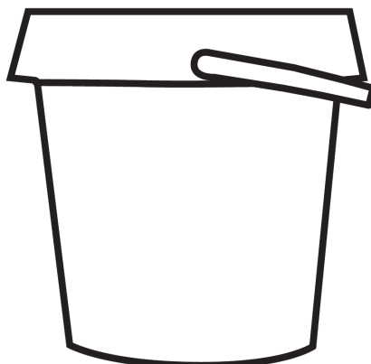
450tk ämbris (18x20cm)