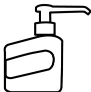
500ml pumbaga pudel